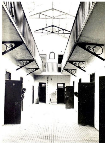
Lámina II. Prisión de Mujeres de Guadalajara, fotografías de Jesús Roperó, 1986.

Lámina II. Prisión de Mujeres de Guadalajara. Detalle de la fachada principal, del acceso al módulo de celdas, y vista de la galería. Fotografías de Jesús Roperó, 1986. Archivo Municipal de Guadalajara, referencia 523111.